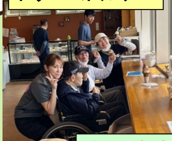
注文と会計は自分でします