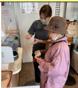
人生初のセルフレジに挑戦