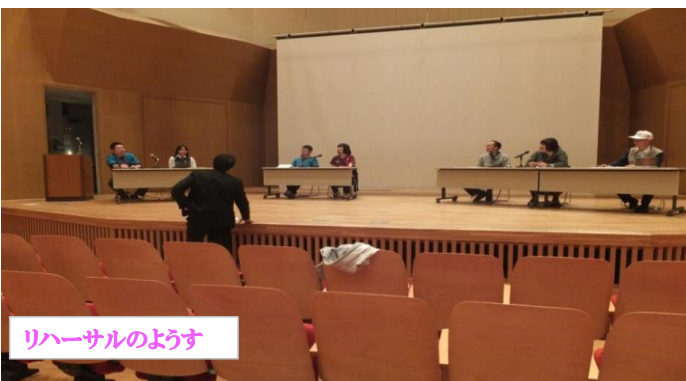
リハーサルのようなす