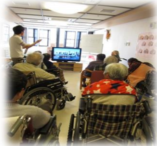
地域交流スペースにて。 楽しい歌声が響いております♪