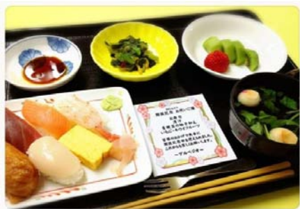
お祝いご膳 メニュー