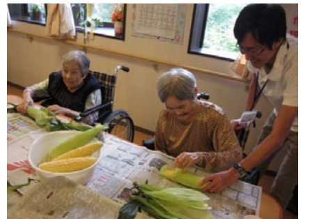
その1 職員もお手伝いさせていただき、皆様に皮をむいていただきます