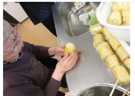
その5 すぐに食べない時は、身がしわしわになってしまうように、熱々のうちにラップで包みます。そうするときれいなとうもろこしでいられます