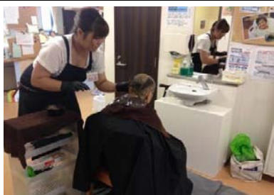
カット・毛染の様子