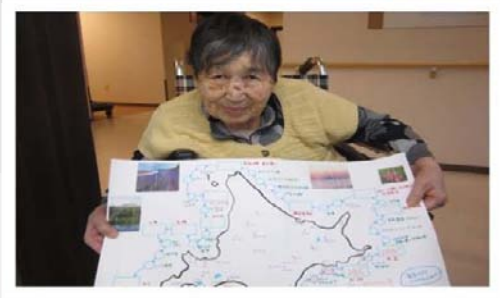
スタッフ手作りの北海道地図です↑