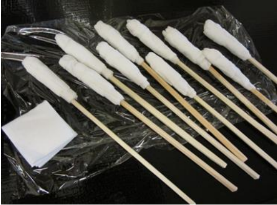
アイスマッサージに使用のお手製スワブ