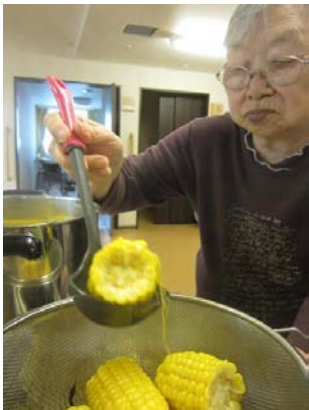
その4 茹であがったとうもろこしをすばやくザルにあげます。

8月5日、職員がガラポン抽選会で当たったとうもろこし、芽室産「未来(みらい)」が届きました！早速、美味しいうちにいただかなくてはと大急ぎで準備開始です！