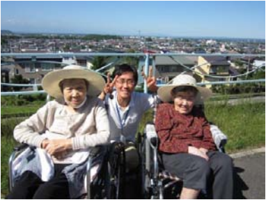
市内が一望できます♪