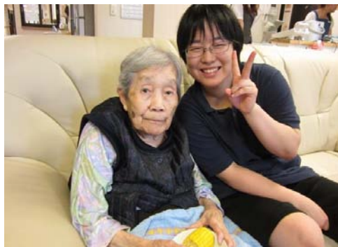
その6 いただきま〜す♪おやつ時間にみなさんと美味しく頂きました。がぶつとかじりつけない方にはほぐして提供しました。