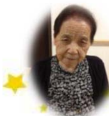
← ご利用後の林道枝様♪