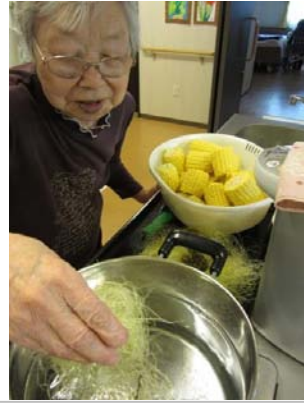
その2 ひげ根も最初から一緒に茹でると旨味が出て、より一層おいしくなるのでここでひげ根と大量の塩を投入！