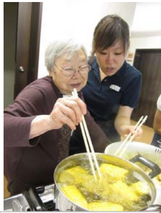
その3 美味しく茹でられるかなあ？沸騰後3～5分間茹でます。