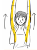
首・肩周部・体側: 頭を下に向けない