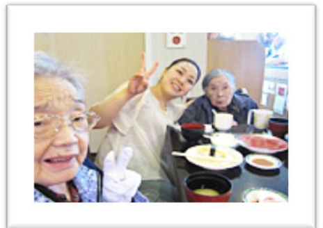
職員も一緒に楽しい時間を過ごせました♪

五月二十四日(金)、ワルツの利用者3名と共に外出レクリエーションへ出かけました。行き先は芽室にある、回転寿司「羽衣亭」です。